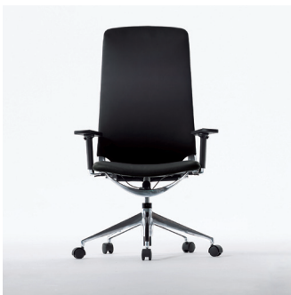
☆MYC0544BLA ¥ 158,000

内側:天然皮革(ブラック) 外側:合成皮革(ブラック) 脚:アルミダイキャスト 昇降式 ロック機能付