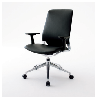
☆MYC0545BLA ¥ 148,000

内側:天然皮革(ブラック) 外側:合成皮革(ブラック) 脚:アルミダイキャスト 昇降式 ロック機能付