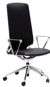
☆MYC1654BL ¥ 155,000

内側:天然皮革(ブラック) 外側:合成皮革(ブラック) 脚:アルミダイキャスト 昇降式 ロック機能付