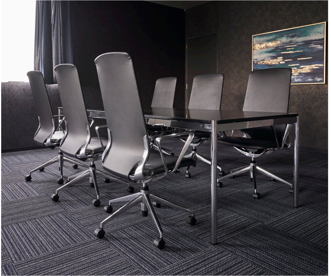
エースジャパンけいはんな研究開発センター MYC1654BL