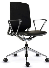
☆MYC1655BL ¥ 145,000

内側:天然皮革(ブラック) 外側:合成皮革(ブラック) 脚:アルミダイキャスト 昇降式 ロック機能付