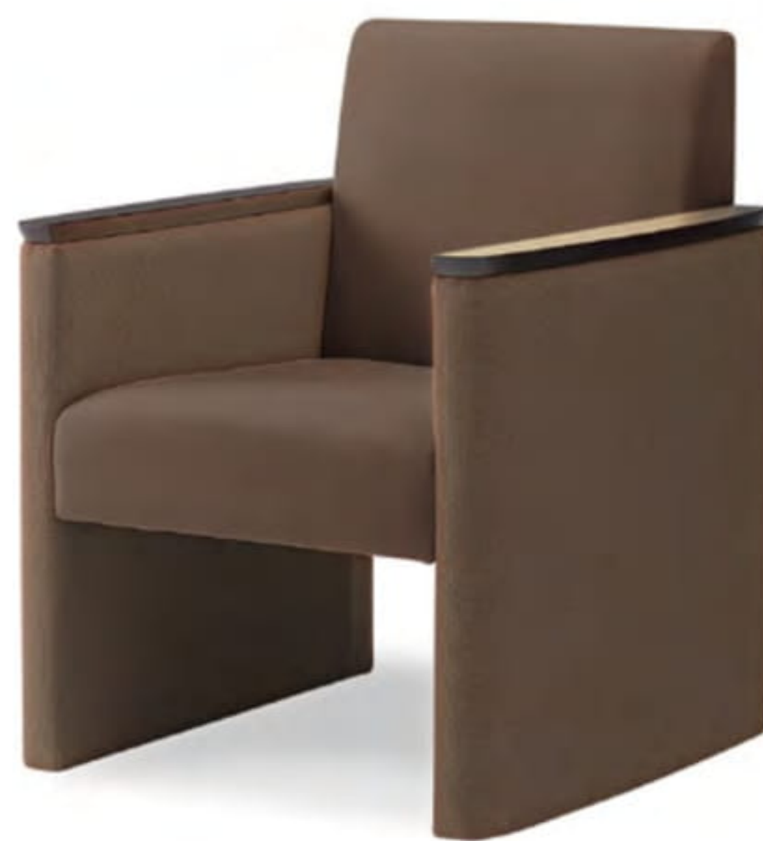
06色 張地 プラハ PU-12(Aランク)