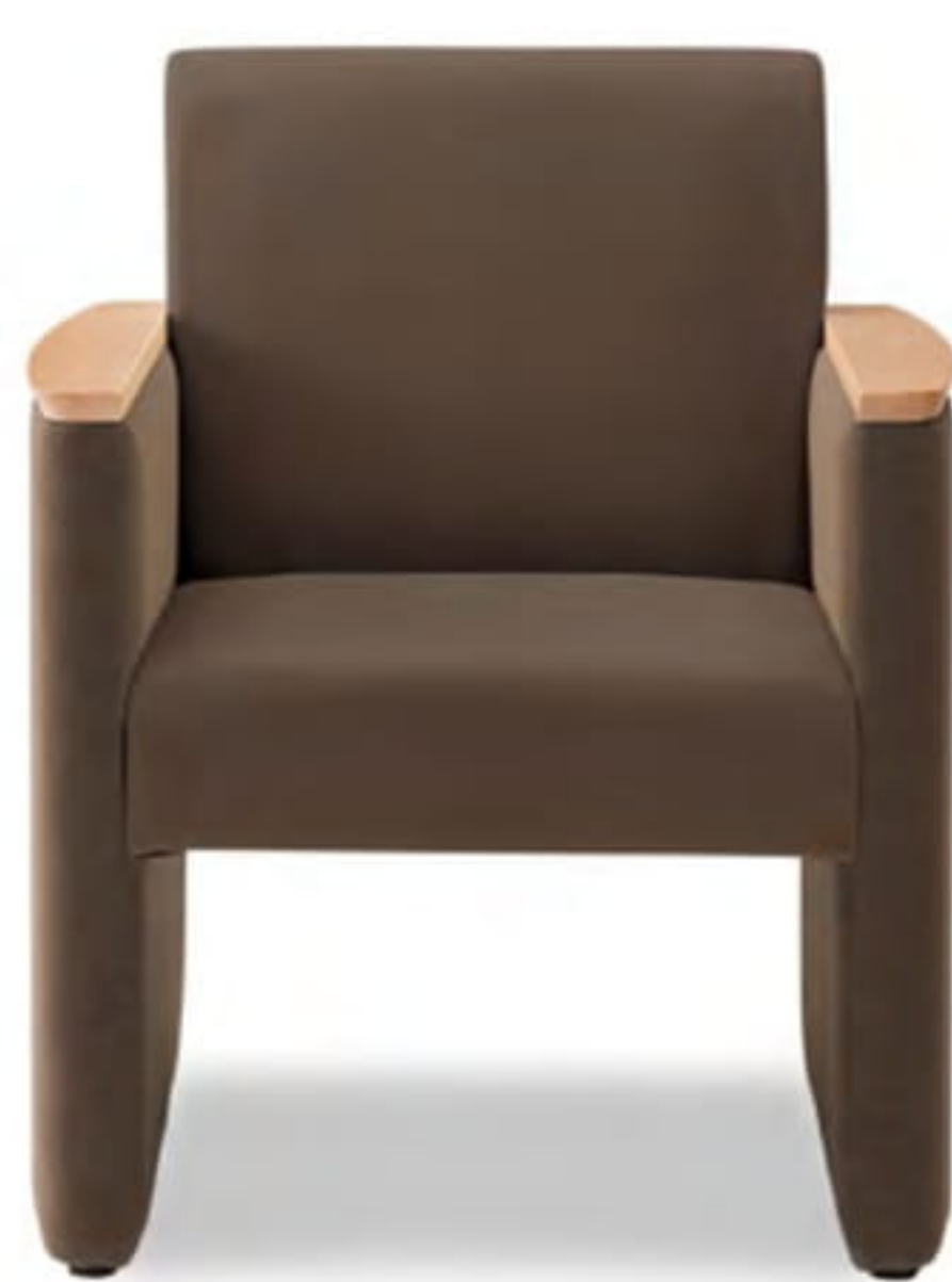
01色 張地 プラハ PU-12(Aランク)