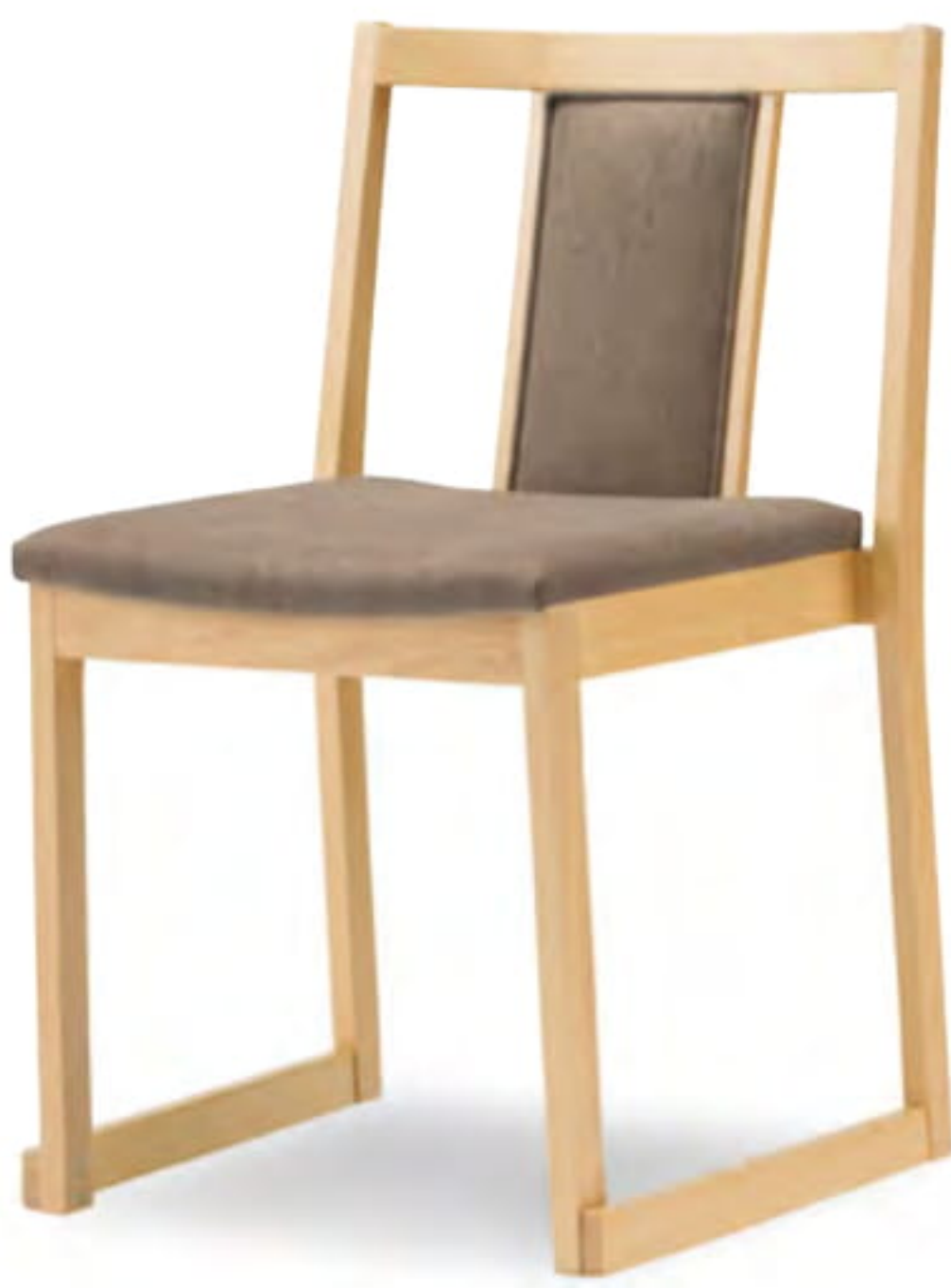
張地 プラハ PU-5(Aランク)