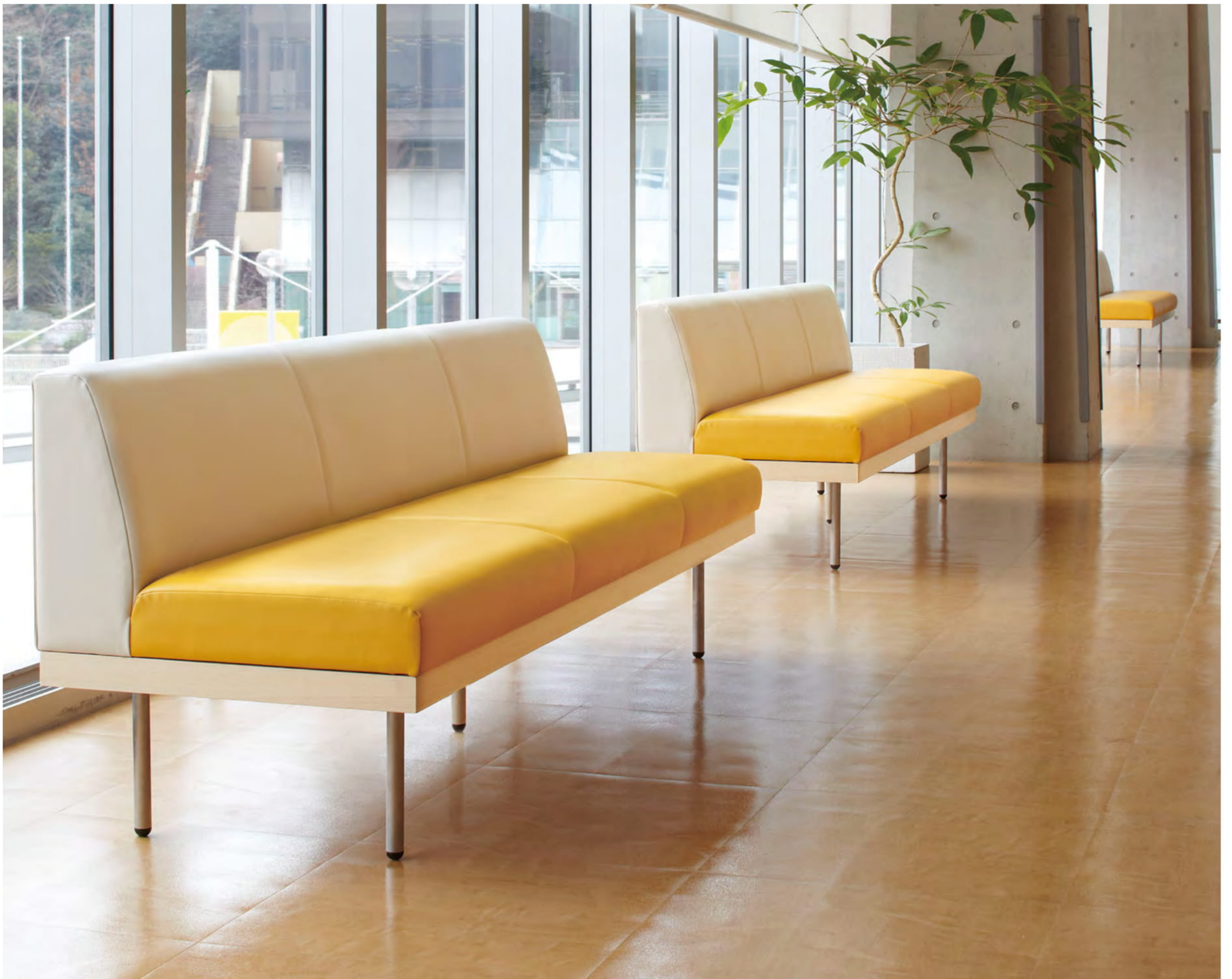
モジュレックス CASE6 S3004-30NS(P.311)