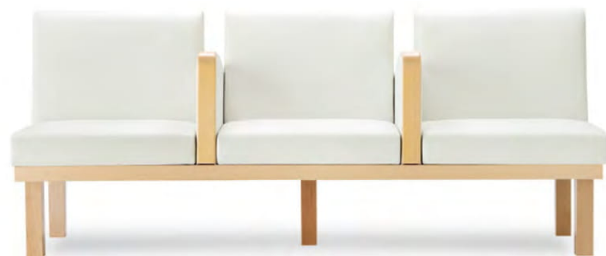
張地 アイコン ICO-1 (Aランク)