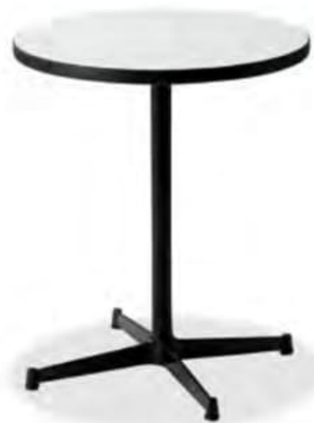
TS-051 T6059-60W ¥43,300

〈仕様〉 600φ×H720 天板 トップ:メラミン化粧板 MW色(ホワイト) エッジ:K-11(ブラック) サイズ:600φ 30t(mm) 脚:TLX550K 支柱:スチール(ブラック粉体塗装) ベース:アルミ鋳物(ブラック粉体塗装)