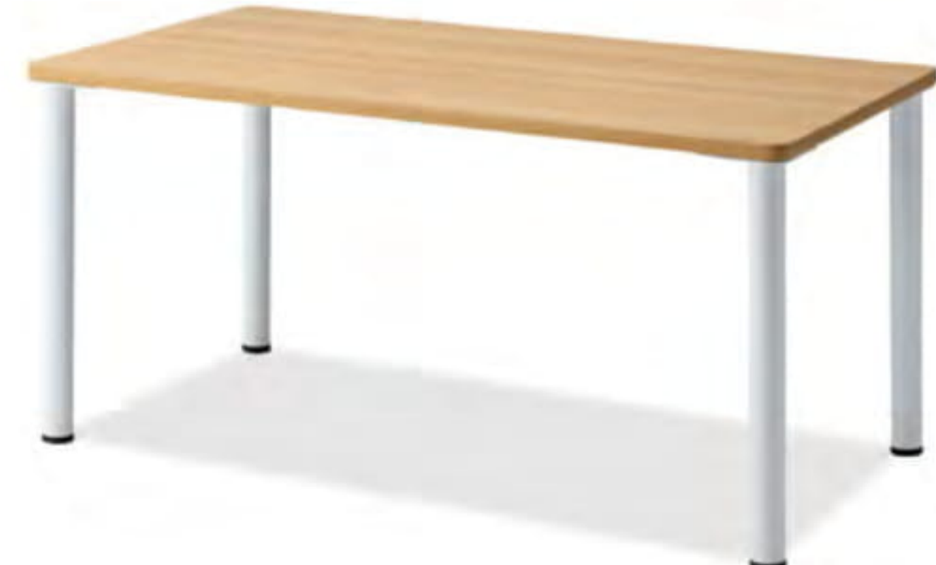
TS-053 T6061-151 ¥84,700

〈仕様〉 W600×D750×H720 天板 トップ:メラミン化粧板 M03色(ライトブラウン) エッジ:K-17(木目ミディアムブラウン) サイズ:600×750 30t(mm) 脚:TLS570K スチール(ブラック粉体塗装)