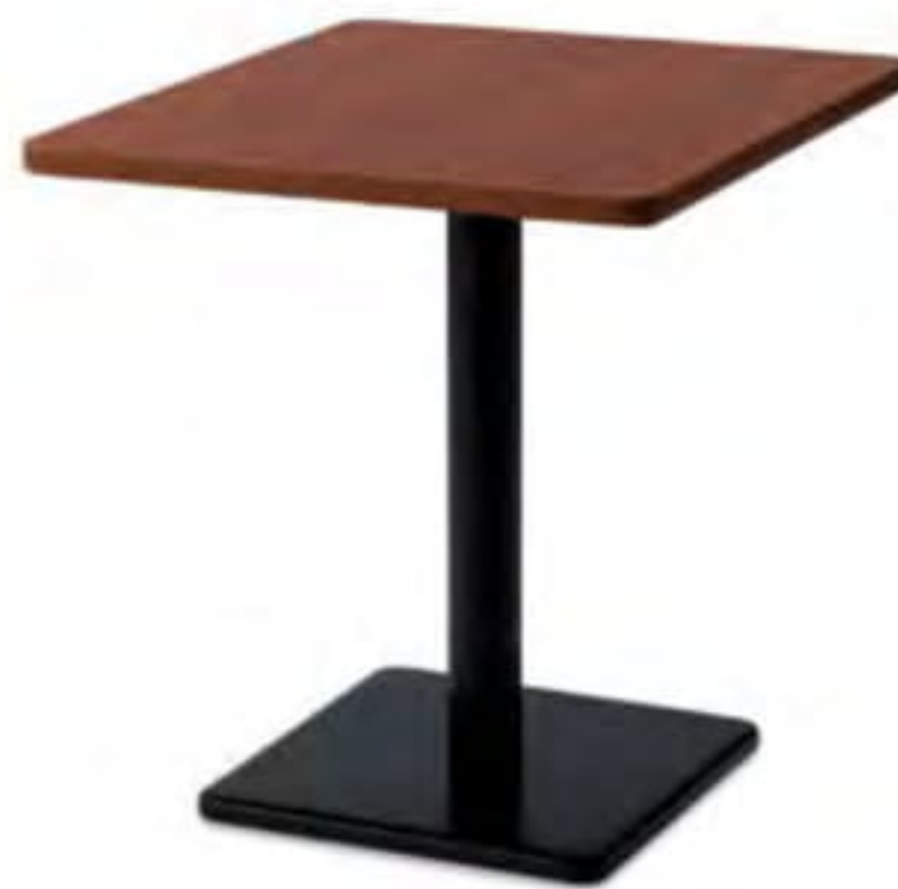
TS-052 T6060-603 ¥53,600

〈仕様〉 600φ×H720 天板 トップ:メラミン化粧板 MW色(ホワイト) エッジ:K-11(ブラック) サイズ:600φ 30t(mm) 脚:TLX550K 支柱:スチール(ブラック粉体塗装) ベース:アルミ鋳物(ブラック粉体塗装)