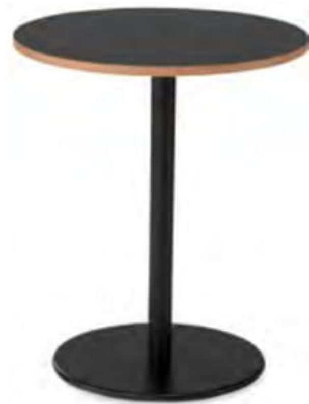
TS-061 T6062-60K 価格はお問い合わせください。

〈仕様〉 550φ×H720 天板 トップ:メラミン化粧板 MBL色(ブラック) エッジ: Aタイプ ブナ積層合板(クリア) サイズ: 550φ 20t(mm) 脚: TLC400K スチール(ブラック粉体塗装)