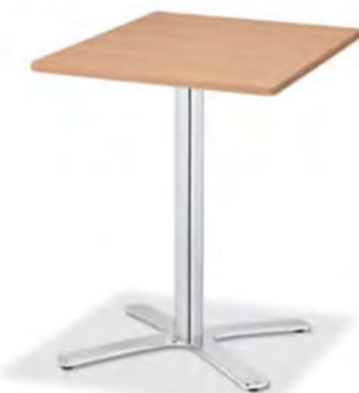
TS-063 T6064-60T1 価格はお問い合わせください。

〈仕様〉 W450×D450×H720 天板 トップ:メラミン化粧板 MT4色(サンドベージュ) エッジ: Aタイプ ブナ積層合板(クリア) サイズ: 450×450 20t(mm) 脚: TLX450A 支柱:スチール(シルバー粉体塗装) ベース:アルミ鋳物(アルマイト仕上)