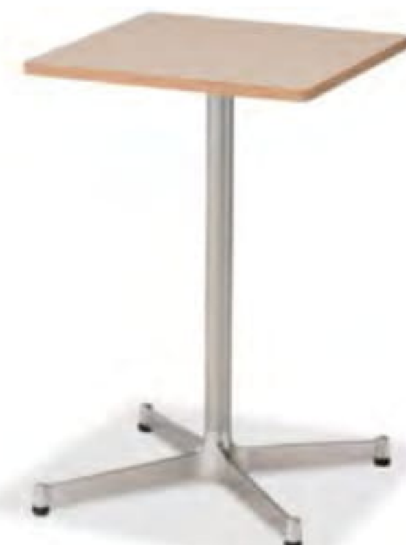
TS-062 T6063-45T4 価格はお問い合わせください。

〈仕様〉 550φ×H720 天板 トップ:メラミン化粧板 MBL色(ブラック) エッジ: Aタイプ ブナ積層合板(クリア) サイズ: 550φ 20t(mm) 脚: TLC400K スチール(ブラック粉体塗装)