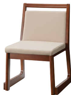
ブラウン 張地：布・ラポーナ・RB-02(A) ¥28,000