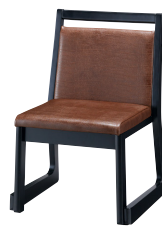
ブラック 張地：レザー・プルアップ・L-8443(C) ¥30,400