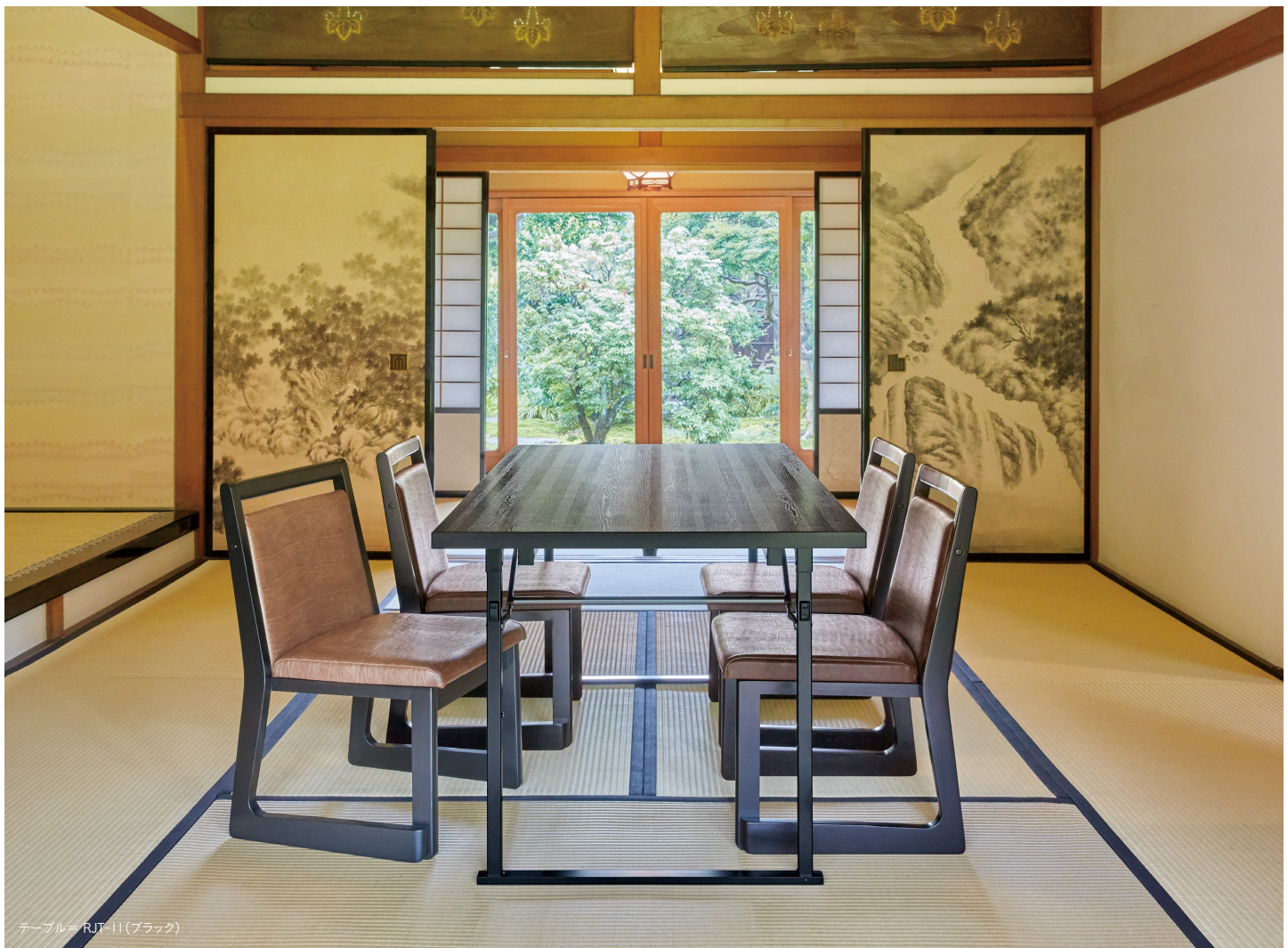
テーブル=RJT-11(ブラック)