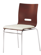
B2 CR-2N レザー・B-15 (No.35)