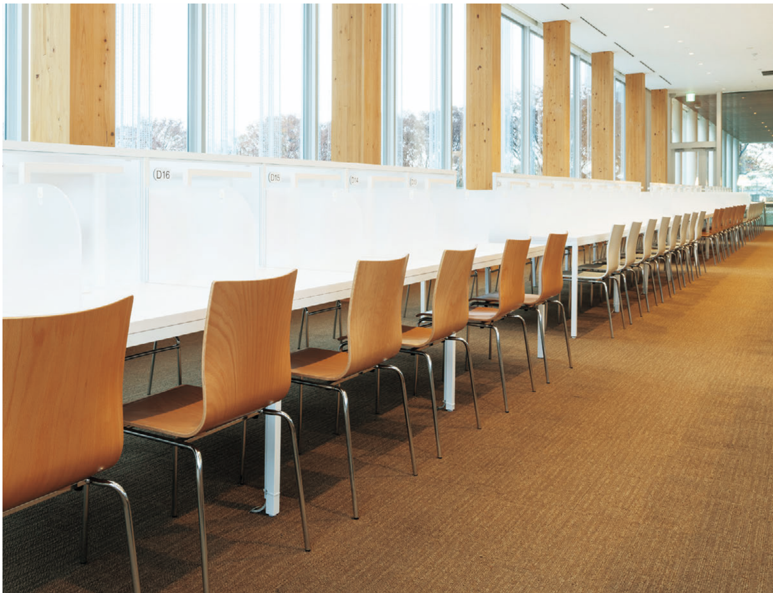
▲フィクスA1 CR-5N フィクスA1 CR-WH ¥28,900