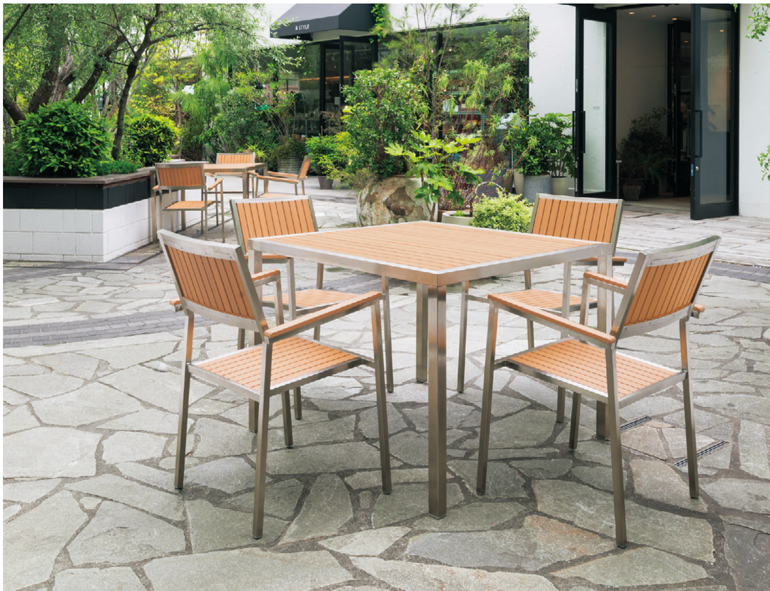
▲ラウト ¥49,800 TB2481-YA ¥112,600