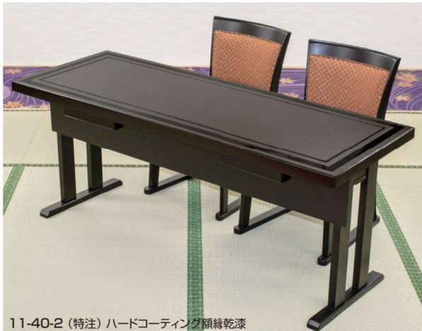
11-40-2 (特注) ハードコーティング額縁乾漆

奥行き D=500・600はD550と同価格です。 高さ H=700の場合は上代プラス3,800円となります。 Fランクの天板裏は黒、側面は同柄塗装、脚部は艶消し黒となります。