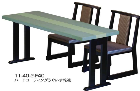
11-40-2-F40 ハードコーティングラウクいす乾漆