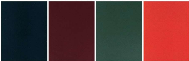
G40 黒鏡面塗 G41 うるみ鏡面塗 G42 グリーン鏡面塗 G43 朱鏡面塗