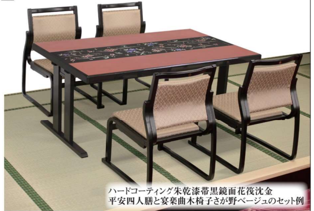
ハードコーティング朱乾漆帯黒鏡面花筏沈金 平安四人膳と宴楽曲木椅子さが野ページュのセット例