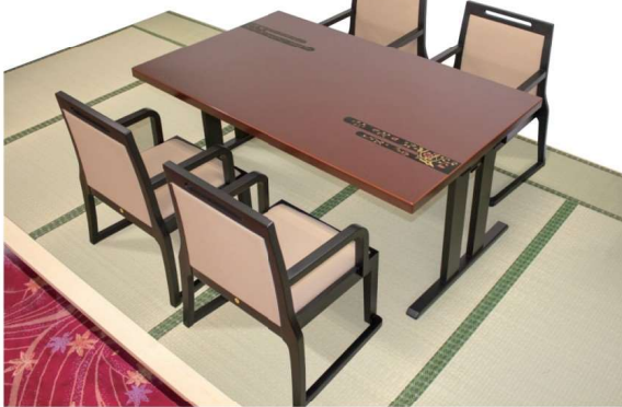
椅子GRANDシリーズ参照