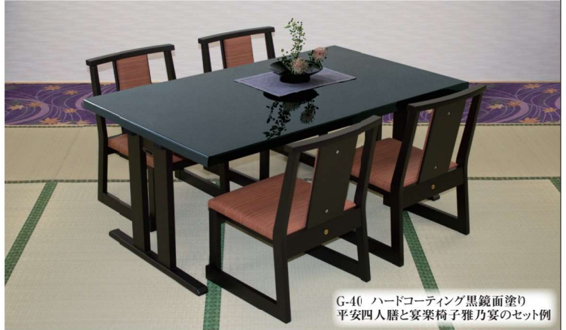
G-40 ハードコーティング黒鏡面塗り 平安四人膳と宴楽椅子雅乃宴のセット例