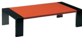
うるし 朱/黒 ✳ 11-107-15 ¥ 356,000 (W1,200・D750・H350) 11-107-16 ¥ 424,000 (W1,500・D750・H350)