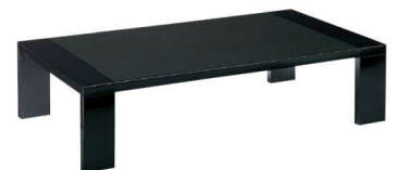
うるし グリーン/黒 ✳ 11-107-17 ¥ 356,000 (W1,200・D750・H350) 11-107-18 ¥ 424,000 (W1,500・D750・H350)