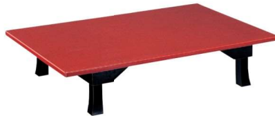
うるし 八光塗朱(幕付折脚) ✳ 11-107-7 ¥ 554,000 (W1,500・D1,000・H320)