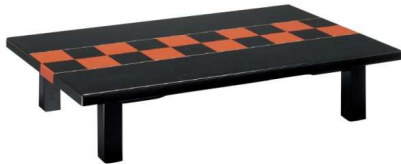
うるし グリーン/朱 ✳ 11-107-19 ¥ 381,000 (W1,200・D900・H320) 11-107-20 ¥ 448,000 (W1,500・D900・H320) 11-107-21 ¥ 540,000 (W1,800・D900・H320)