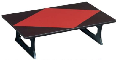
ハードコーティング乾漆塗ダイヤ うるみ/朱 ✳ 11-107-1 ¥ 270,000 (W1,200・D750・H320) 11-107-2 ¥ 330,000 (W1,500・D750・H320)