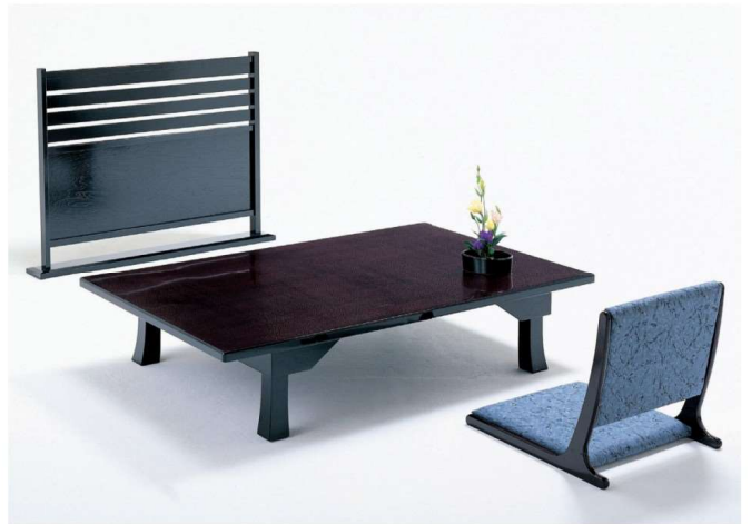
うるし 八光塗うるみ(幕付折脚) ✳ 11-107-5 ¥ 513,000 (W1,500・D1,000・H320) うるし うるみ(幕付折脚)サイドテーブル ✳ 11-107-6 ¥ 244,000 (W1,000・D500・H320)