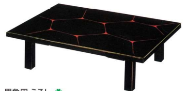
黒亀甲 うるし ✳ 11-107-28 ¥ 302,000 (W1,200・D900・H320) 11-107-29 ¥ 352,000 (W1,500・D900・H320) 11-107-30 ¥ 470,000 (W1,800・D900・H320)