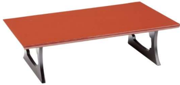
うるし 朱 ✳ 11-107-3 ¥ 410,000 (W1,200・D750・H320) 11-107-4 ¥ 495,000 (W1,500・D750・H320)