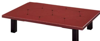
朱亀甲 うるし ✳ 11-107-25 ¥ 302,000 (W1,200・D900・H320) 11-107-26 ¥ 352,000 (W1,500・D900・H320) 11-107-27 ¥ 470,000 (W1,800・D900・H320)