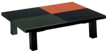
うるし 朱/グリーン ✳ 11-107-9 ¥ 279,000 (W900・D900・H320) 11-107-10 ¥ 338,000 (W1,200・D900・H320) 11-107-11 ¥ 392,000 (W1,500・D900・H320)