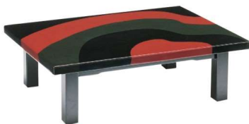
うるし 塗分け ✳ 11-107-12 ¥ 261,000 (W900・D900・H320) 11-107-13 ¥ 280,000 (W1,200・D900・H320) 11-107-14 ¥ 333,000 (W1,500・D900・H320)