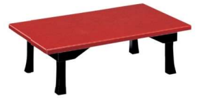
うるし 八光塗朱(幕付折脚)サイドテーブル ✳ 11-107-8 ¥ 261,000 (W1,000・D500・H320)