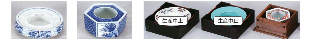
11-194-35 竹林4.5灰皿 ¥ 1,080 (135φ・H38)