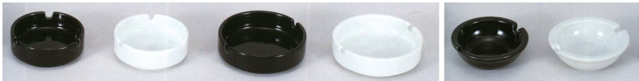
11-194-1 黒丸三ツ切スタック灰皿 ¥ 450 (90φ・H28)