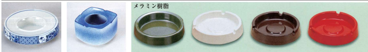
11-194-43 菊間取6.0灰皿 ¥ 2,800 (190φ・H50)