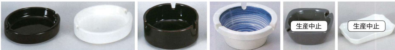
11-194-7 夕円灰皿(黒) ¥ 470 (W105-D85-H25)