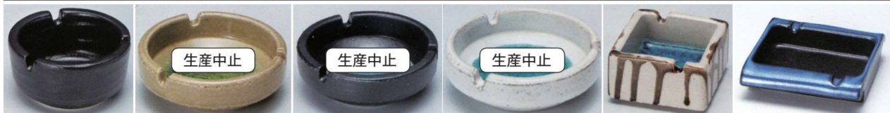
11-194-19 黒ゆず三ツ切灰皿 ¥ 960 (108φ・H52)