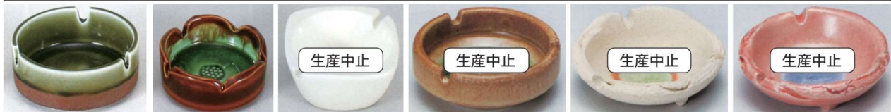
11-194-13 ビードロ3.0灰皿 ¥ 720 (102φ・H43)