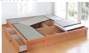
●畳下は収納スペース