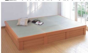
●中央畳をセットすればフラットな畳コーナーに