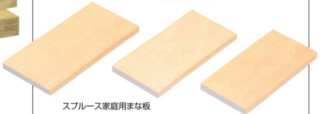
スプルス家庭用まな板