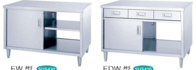
EW 型 SUS430 ステンレス戸仕様 両面仕様