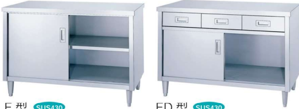
E 型 SUS430 ステンレス戸仕様