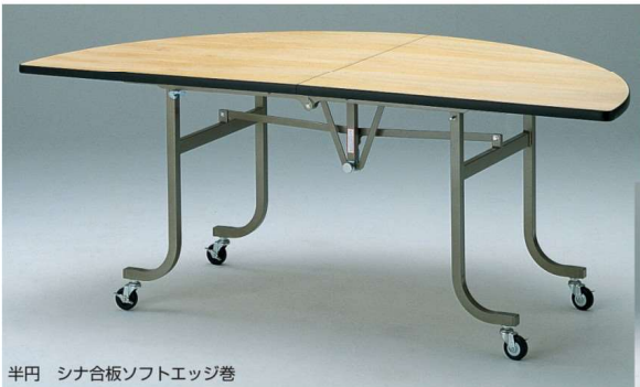
半円 シナ合板ソフトエッジ巻