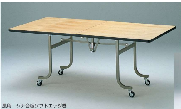
長角 シナ合板ソフトエッジ巻