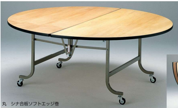
丸 シナ合板ソフトエッジ巻

共通仕様 レセプションフライト 天板/シナベニア 茶ソフトエッジ巻 脚/2.6cm角パイプ 塗装 キャスター付(ストッパー付)