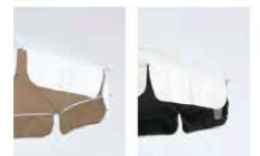
ベージュ (Whiteのみ) ブラック (全色)