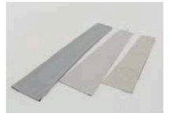
収納袋 M.U.の大きさにより付属されます。