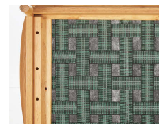
ボトム:ウェーピングベルト