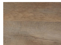
古木柄(立体紙) 立体的な加工をプラスし古木のヒ ビ割れ(プリント)やザラつき等の 質感を表現した紙貼り仕様です。