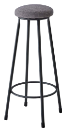
(張地F:ダークスモーク)