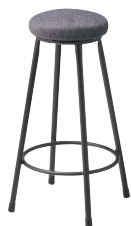
(張地F:ダークスモーク)