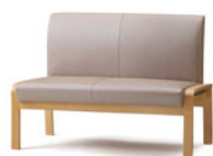
D1730 ヤンセン (コンパクトタイプ) P173