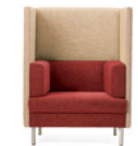
KR100 リクラ P190