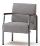
D6210 ラップ・ロビーチェア (高座タイプ) P179