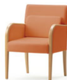
W085 ロールアーム P189