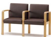
D1820 タッカー2 P175