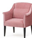
L2034 オアシス (授乳用) P189