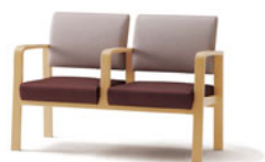
D1740 ヤンセン (肘なしタイプ) P173