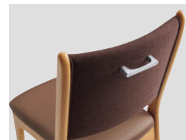
アルミハンドル AHD-102AL ¥2,000(税別)

素材：天板/メラミン化粧板・ 脚部/スチール角パイプ・ ガンメタリック・粉体塗装 サイズ：W1800・D900・H700 重量：34.6kg