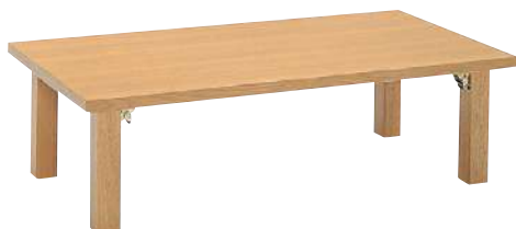
● S・TZ-341・NB2・X 品 ¥ 85,600 W1,200・D600・H330