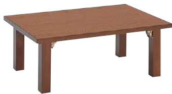
● S・TZ-341・K・A 品 ¥ 80,500 W900・D600・H330