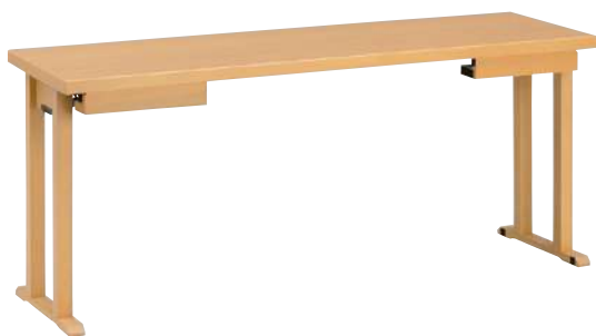
● S・TZ-344Z・□ 品 ¥ 131,000 W1,500・D450・H640/350