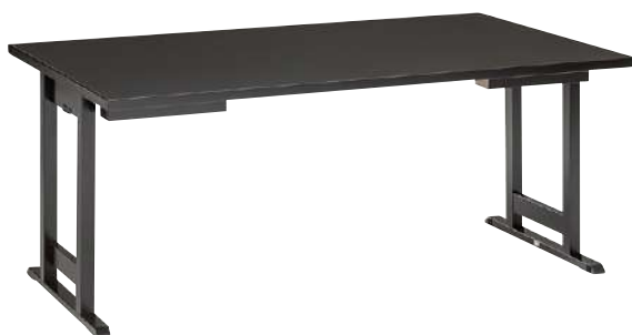
● S・TZ-346・□ 品 ¥ 175,000 W1,500・D900・H640/350