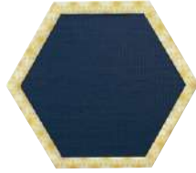
● S-OC-A032-E 枠型(外:t38/内:t18) ¥ 40,800 W900-D780