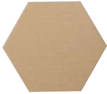
● S-OC-A032-A ノーマル(t18) ¥ 29,900 W900-D780