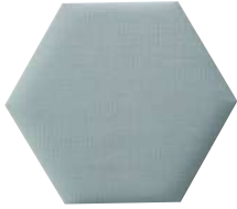
● S-OC-A032-D 厚型(t38) ¥ 33,600 W900-D780