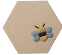
● S-OC-A032-C ハチ柄(t18) ¥ 49,200 W900-D780