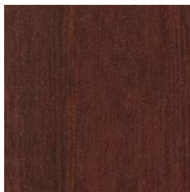
DB2色 ダークブラウンビーチ色