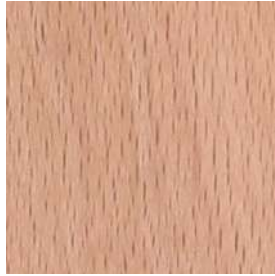
NB色 ナチュラルビーチ色

※ナチュラル色系の塗装は木の生地色を生かした塗装色の為、多少の個体差があります。