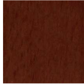
MB色 ミディアムブラウンビーチ色