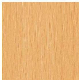
NB2色 ナチュラルビーチ色

※木目の質感を表現するために、エンボスが強いデザインになっています。文字を書くのに適したエンボス(Uエンボスタイプ)や、共張り用の同色・柄のポリエステル合板もご用意しております。詳しくはお問い合わせください。