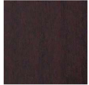
DB色 ダークブラウンビーチ色