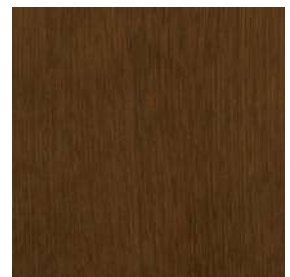
MO2色 ミディアムブラウンオーク色