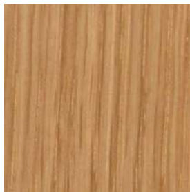
NO色 ナチュラルオーク色