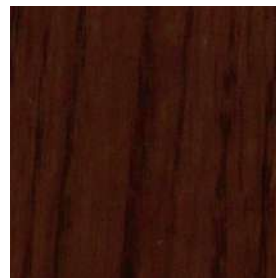
MO色 ミディアムブラウンオーク色