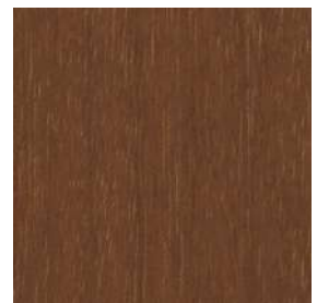
MB2色 ミディアムブラウンビーチ色