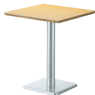
ST969 (NA) -E・BT304-T W600・D600 天板 ¥25,400 脚部 ¥17,000 ベース：アルミ色塗装・AJ付 ポール：アルミ色塗装 (組立式)