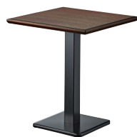
ST969 (BR) -E・BT301-T W600・D600 天板 ¥25,400 脚部 ¥19,000 ベース：クロ塗装・AJ付 ポール：クロ塗装 (組立式)