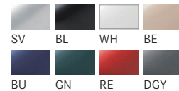
SV BL WH BE BU GN RE DGY