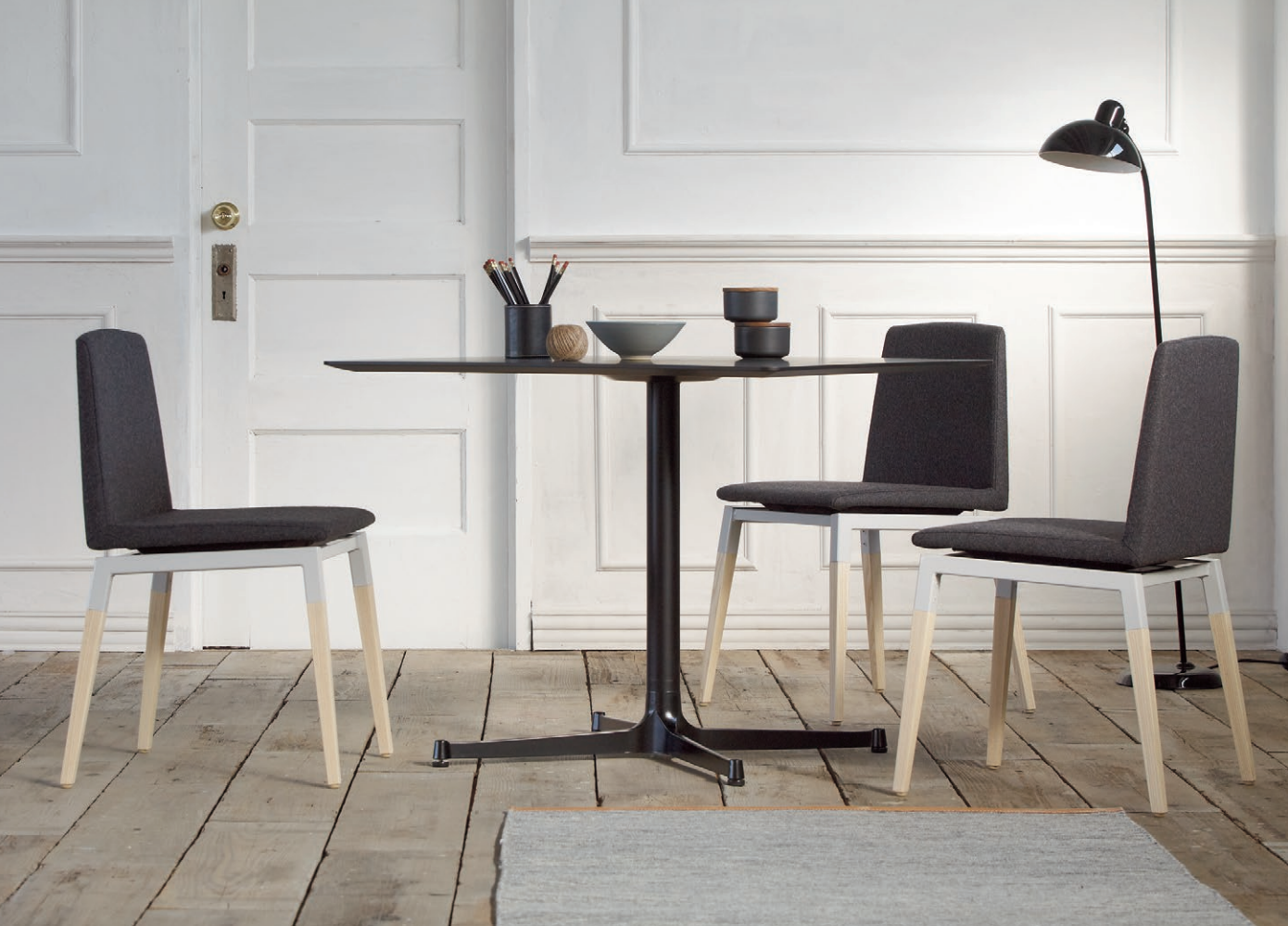
Table : 参考商品