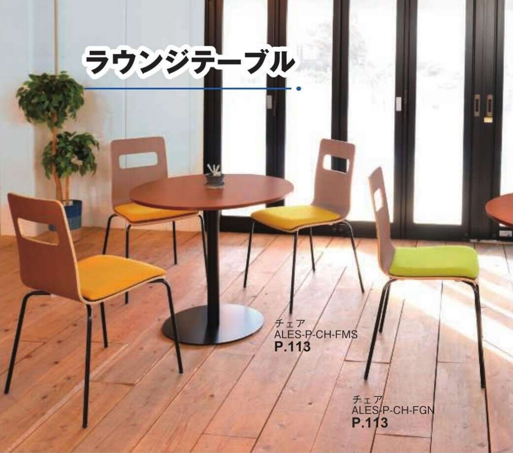
チェア ALES-P-CH-FMS P.113