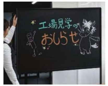
POP ゲルチョークを使った例 (POP ゲルチョークは別売です)

書き消し耐久性抜群 デュアルコート・ニッケルホーロー 板面 断面図 デュアルコート・ニッケルホーローは 表面ホーロー層が2層構造を形成しているため 表面硬度が高く、繰り返し書き消しができるの が特長です。