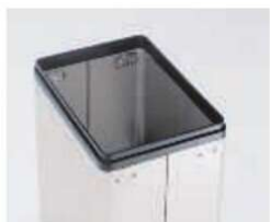
BTT説明(袋止めバインダー)