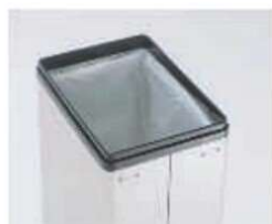
BTT説明(袋止めバインダー取付例)