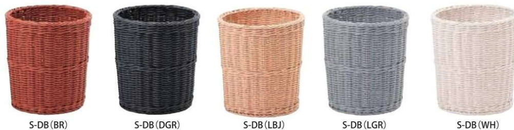
S-DB(BR) S-DB(DGR) S-DB(LBJ) S-DB(LGR) S-DB(WH)