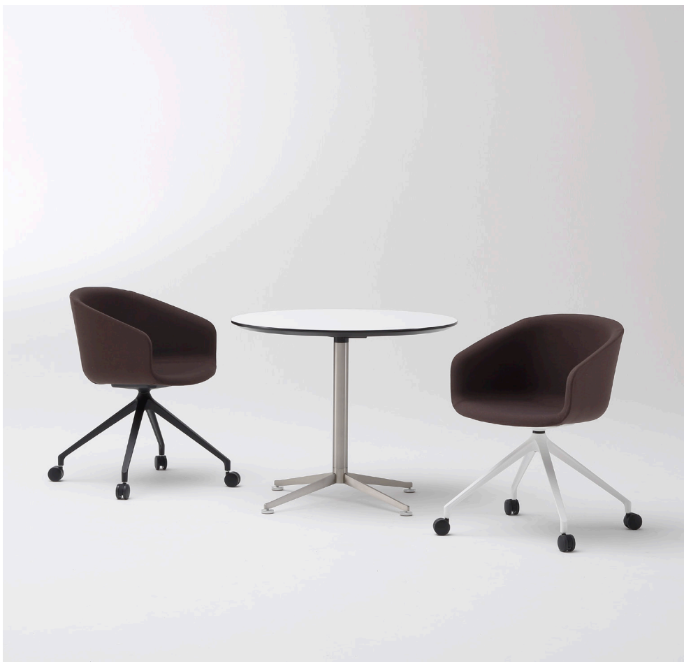
左:MUC0406BD 右:MUC0405BD テーブル:MYT0226WHA(P.125)