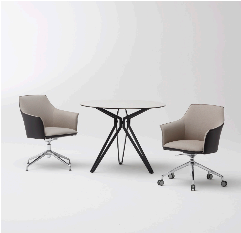
左:MYC1557MI 右:MYC1556MI テーブル:MYT0650WH(P.119)