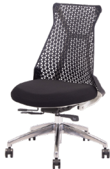
MUC0669BL ¥ 75,000

背面:ナイロン樹脂(ホワイト) 座面:ファブリック(ブラック) 背柱:樹脂(ブラック) 脚:アルミダイキャスト