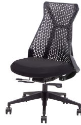
MUC0673BL ¥ 63,000

背面:ナイロン樹脂(ブラック) 座面:ファブリック(ブラック) 背柱:樹脂(ホワイト) 脚:アルミダイキャスト