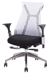
MUC0662BL ¥ 79,800

背面:ナイロン樹脂(ホワイト) 座面:ファブリック(ブラック) 背柱:樹脂(ブラック) 脚:アルミダイキャスト アーム:樹脂(ブラック)スチール(クロムメッキ)