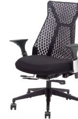
MUC0672BL ¥ 65,000

背面:ナイロン樹脂(ブラック) 座面:ファブリック(ブラック) 背柱:樹脂(ホワイト) 脚:アルミダイキャスト アーム:樹脂(ブラック)スチール(クロムメッキ)