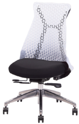
MUC0663BL ¥ 75,000

United States Design Patent 意匠登録済 (US D686,441S) 背面のナイロン樹脂は、Dupont Zytel 70G33L NC010を使用しています。