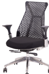
MUC0668BL ¥ 79,800

背面:ナイロン樹脂(ホワイト) 座面:ファブリック(ブラック) 背柱:樹脂(ブラック) 脚:アルミダイキャスト アーム:樹脂(ブラック)スチール(クロムメッキ)