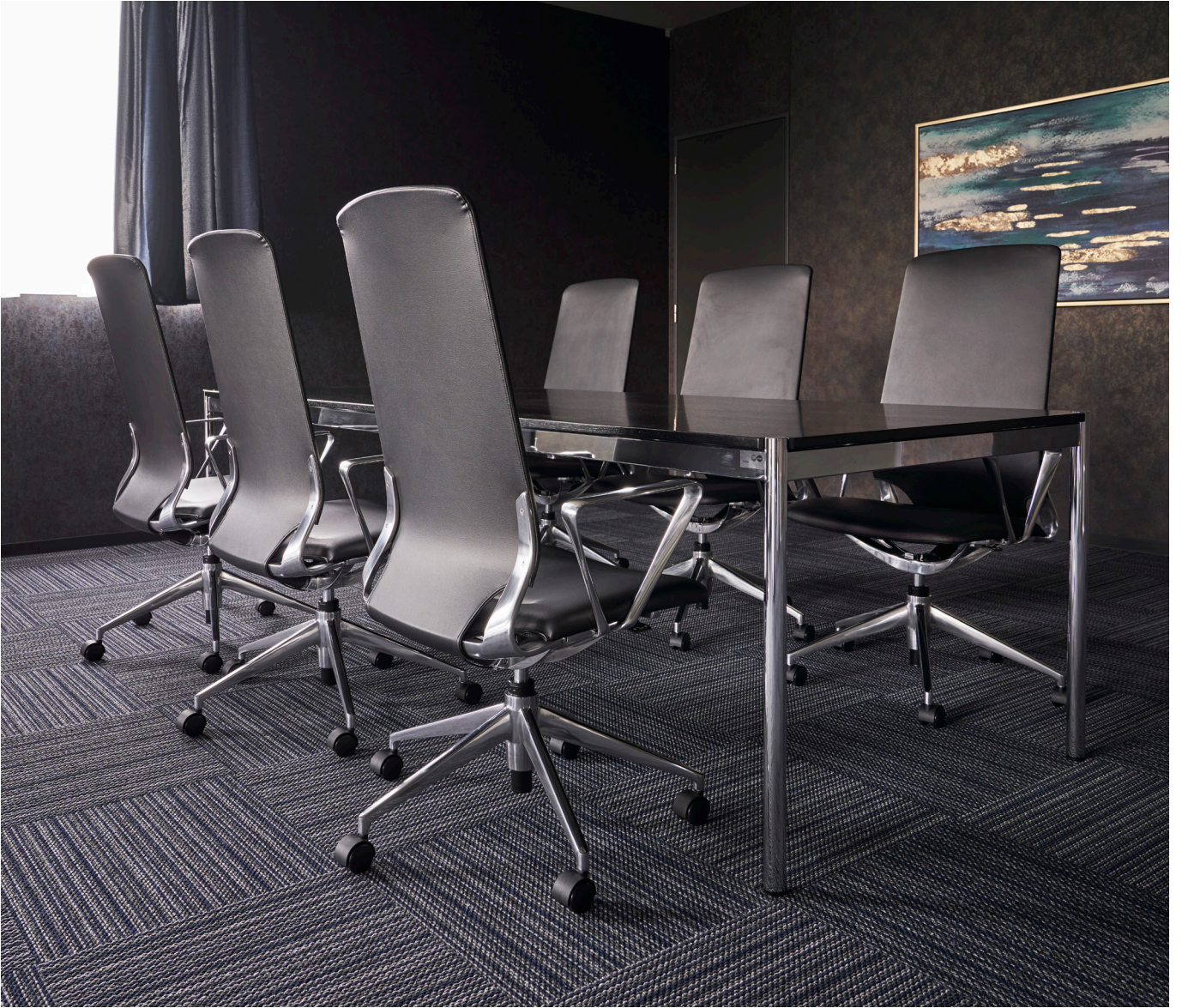
エースジャパンけいはんな研究開発センター MYC1654BL