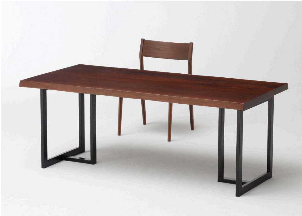
写真:MUT0500TBD+MUT0502LBL チェア:MUC0604BL (P.059)