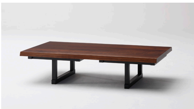
脚を上記写真の様にセットすることで、ローテーブルとしてもお使い頂けます。テーブルトップ迄(H355)