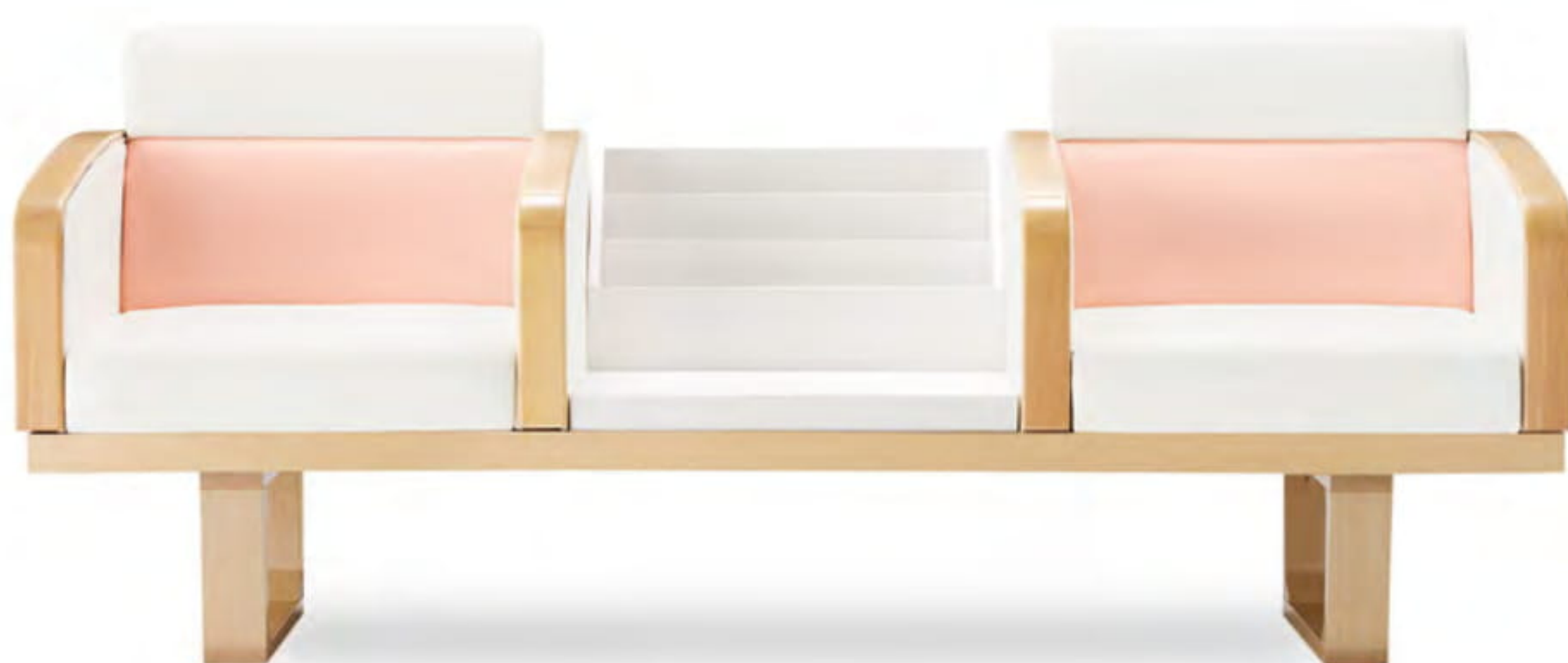
張地 背・肘・座 アイコン ICO-1 (Aランク) 背下 アイコン ICO-23 (Aランク) (P.312 CASE7 木製脚 Bタイプ)

お腹が大きい妊婦さんの身体に配慮し、お腹への負担を和らげ、腰をしっかり安定させます。体が沈み込みすぎないので立ち上がりもラクラクです。