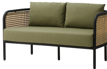
L 張地: サンプルラ・18011-0000(GB) ¥288,300

屋外対応クッション用張地: サンプルラ/アクリル100% ＊長時間雨ざらしにするとクッション内に入った水分が乾きにくくなります。 ＊布の特性上、縫製部分にシワが目立つ場合があります。予めご了承下さい。