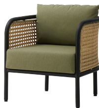
M 張地: サンプルラ・18011-0000(GB) ¥175,800

サンプルラはP273からお選びください。 ＊背と座の2色張りにつきましては、別途お見積もりとさせていただきます。