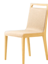
5N 布地・D-54 (アイボリー)