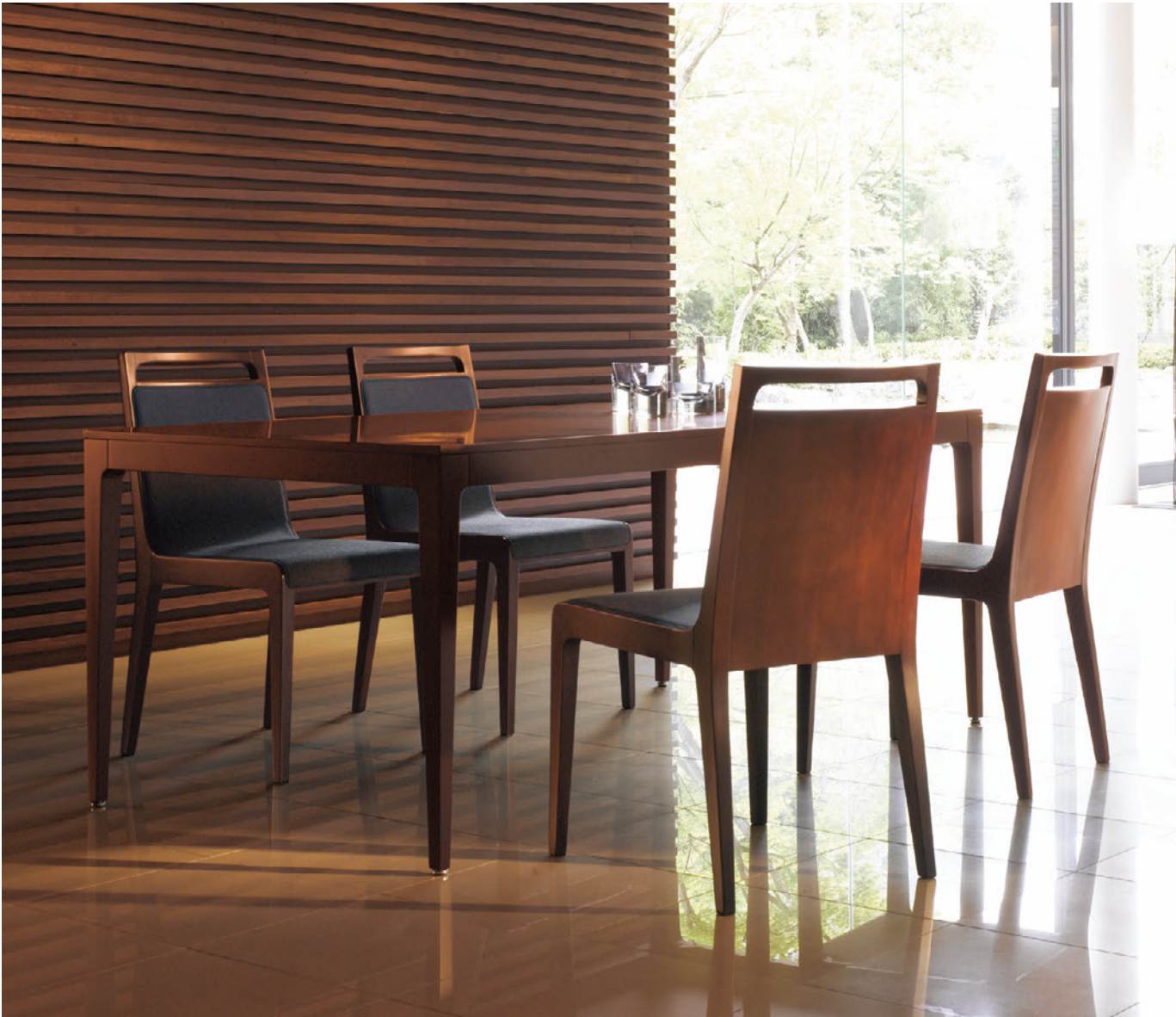
▲ミールス 1N ¥49,500 張材:布地・C-53 (ダークグレー) テーブル:参考品