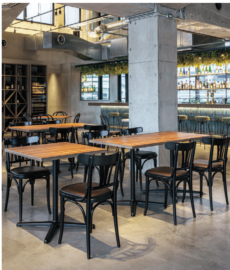
▲アーベル2 BL 張材:レザー・参考品