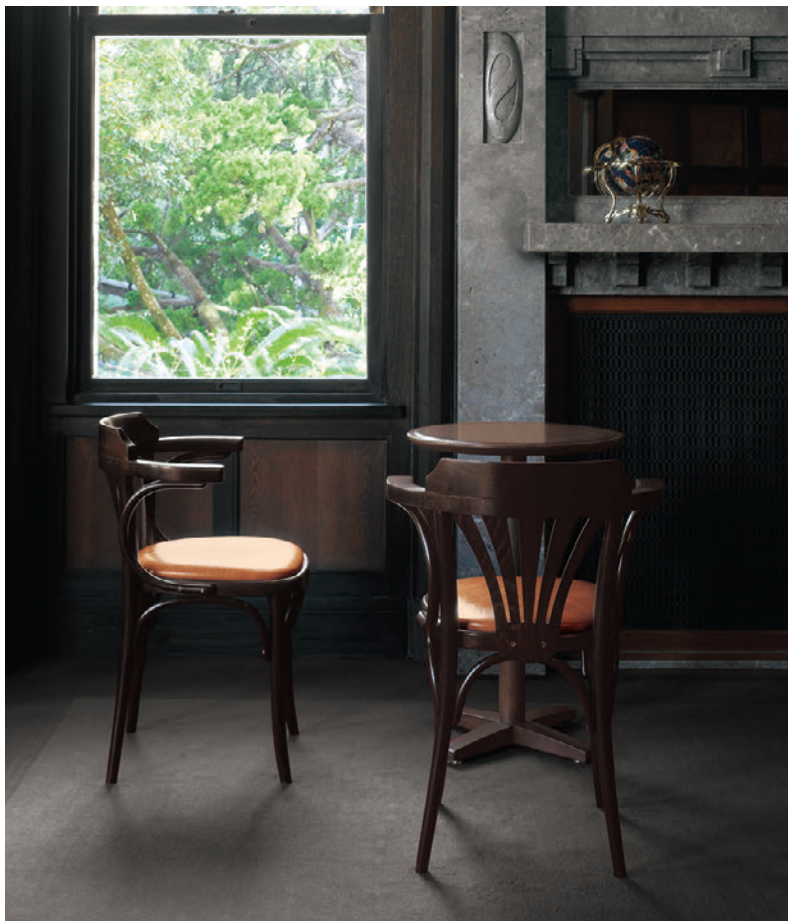
▲クエント2 DB ¥79,300 張材:レザー・B-09 (No.3)