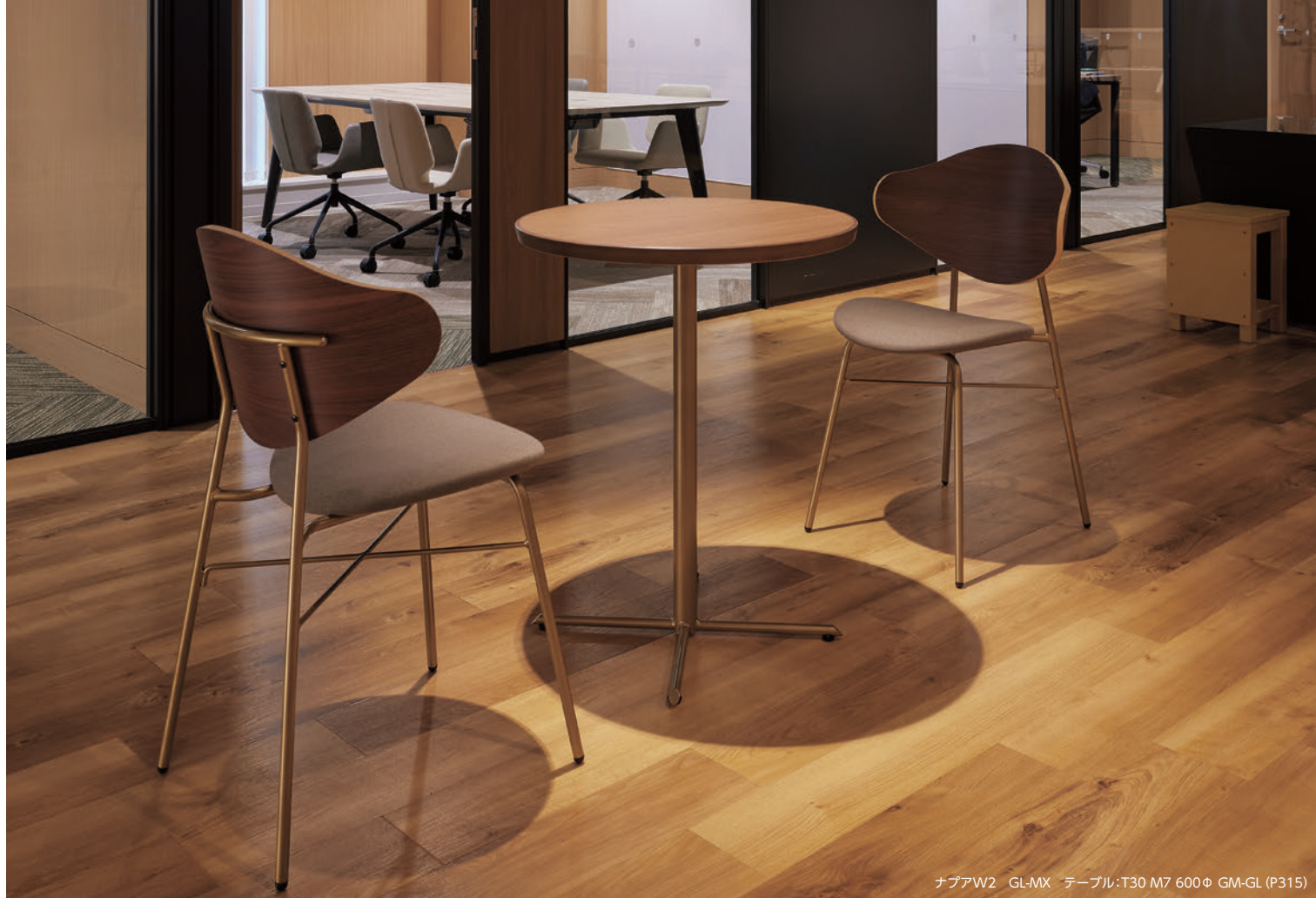
ナプアW2 GL-MX テーブル:T30 M7 600φ GM-GL (P315)