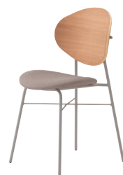
2 SI-MN ¥38,100 レザー・C-38 (No.5)