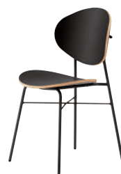
1 BL-MB ¥37,200