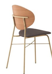
2 GL-MN ¥38,100 レザー・C-38 (No.13)