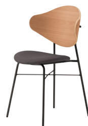
2 BL-MN ¥40,600 レザー・C-38 (No.13)