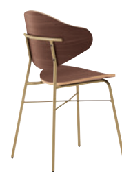
1 GL-MX ¥39,800