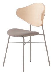
2 SI-ML ¥40,600 レザー・C-38 (No.5)