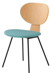
2 BL-NA ¥35,700 レザー・C-12 (No.23)