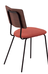
MD ¥33,400 布地・D-23 (ローズ)