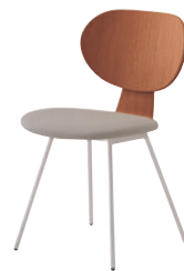
2 SI-3N ¥35,700 レザー・C-04 (No.7)