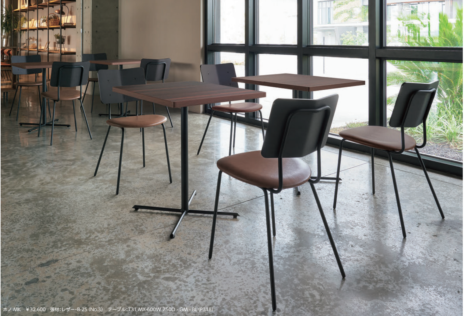
ホノ MK ¥32,600 張材:レザー・B-25 (No.3) テーブル:T31 MX-600W 750D - GM - BL (P318)