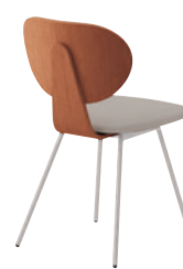
2 SI-3N ¥35,700 レザー・C-04 (No.7)