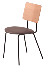
ML ¥31,900 レザー・A-80 (No.71)