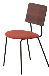
MD ¥33,400 布地・D-23 (ローズ)