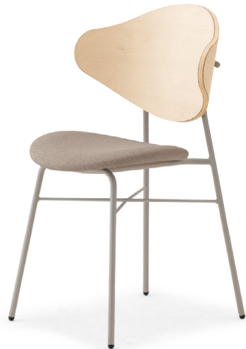
ナプアW2 SI-ML ¥40,600 張材: レザー-C-38 (No.5)

◀ ナプアM1 GL-MX ¥37,200 テーブル: TB2923-YJ-DB (P341)