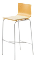
2 5N レザー・A-80 (No.70)