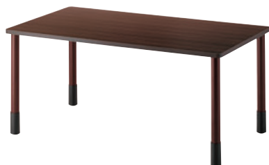
T20 M9-1600W 900D - MG-DB ¥106,100