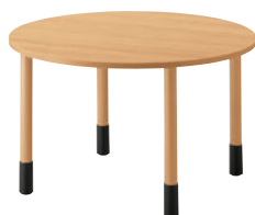
T20 M2-1200φ - MG-NA ¥101,100