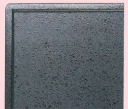
11-50-11 モスグリーン石目塗