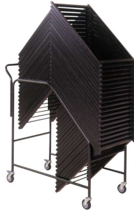
11-50-3 軽量おひとり洋膳脚専用ワゴン ¥86,000

◆前板は脱着式で、色を変更可能です。 朱/黒の前板で気分を変えたお席になります。