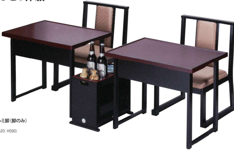
11-50-1 軽量おひとり洋膳アルミ脚(脚のみ) ¥26,000 (天板積載時寸法: W700・D520・H590)