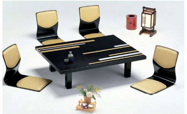
ハードコーティング塗 金/銀乾漆(折脚) 11-123-8 ¥ 145,200 (W1,200・D900・H325) 11-123-9 ¥ 165,000 (W1,500・D900・H325) 11-123-10 ¥ 189,000 (W1,300・D900・H325)