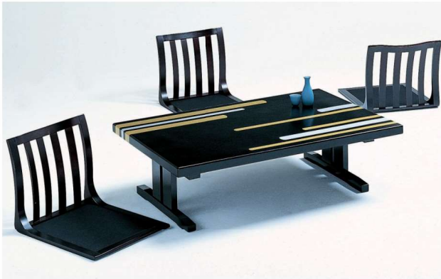
ハードコーティング塗 金/銀乾漆(板型) 11-123-5 ¥ 246,000 (W1,200・D750・H325) 11-123-6 ¥ 290,000 (W1,500・D750・H325) 11-123-7 ¥ 336,000 (W1,800・D750・H325)