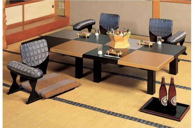
11-123-4 ハードコーティング塗 金乾漆(折脚) ¥ 126,700 (W900・D900・H325)