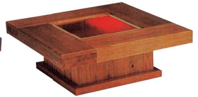
11-144-7 火鉢松節付ムク板 ¥ 501,600 (W1,000・D1,000・H330) 11-144-8 火鉢ケヤキ突板 ✕ ¥ 369,600 (W1,000・D1,000・H330)