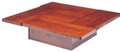
11-144-2 火鉢タモムク ¥ 402,600 (W1,000・D1,000・H320)