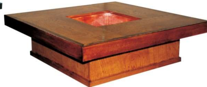
11-144-10 火鉢 松突板 ✕ ¥ 475,200 (W1,200・D1,200・H330)