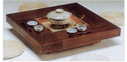
11-144-3 囲炉裏(炭火用) 松節付ムク板 ¥ 393,800 (W1,000・D1,000・H250)