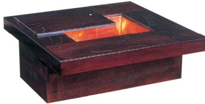
11-144-6 火鉢 割烹タイプ ケヤキ突板 ✕ ¥ 422,400 (W1,200・D900・H330)