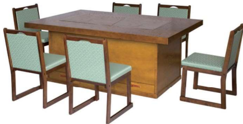
11-144-12 火鉢 栓突板 オーク色 ¥ 900,000 (W1,800・D1,100・H700) ステンレス内寸 (W1,200・D500・H150 天板上部からの深さ)