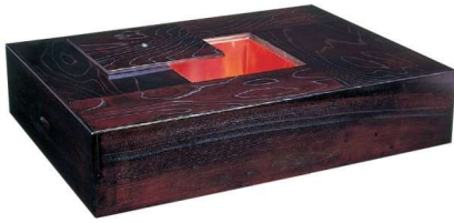
11-144-1 火鉢 割烹用 ケヤキ突板 ✕ ¥ 303,600 (W1,200・D900・H210)