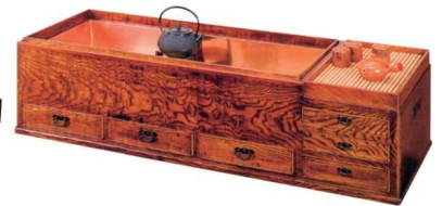
11-144-11 長火鉢タモ材無垢 ¥ 1,815,000 (W1,510・D520・H370)