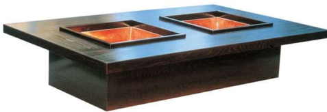
11-144-9 火鉢 ケヤキ突板 ✕ ¥ 501,600 (W1,800・D1,050・H320)