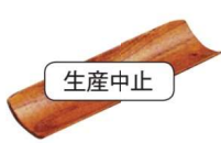
11-192-3 ㊦ 榊傘 おしぼり受け ¥ 880 (W175・D55・H20)