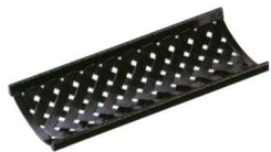
11-192-6 ㊦ 竹目おしぼり受け 黒 ¥ 620 (W170・D70・H20) 全面塗