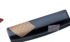
11-192-20 ㊦ 時代色紙 おしぼり受け ¥ 1,490 (W179・D81・H16)