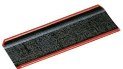
11-192-16 ㊦ 布目おしぼり受け 黒天朱 ¥ 640 (W178・D72・H13)