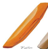
アンバー 11-192-29 ¥ 390 (W182・D70・H21) アンバー・スモーク・ブルー