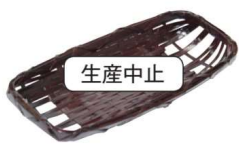
11-192-1 ㊦ 雅竹おしぼり受け ¥ 960 (W175・D70・H20)