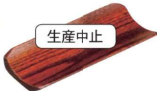
11-192-8 ㊦ 竹型おしぼり受け ¥ 860×5 (W185・D57・H20)