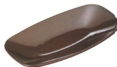
11-192-9 ㊦ 会席おしぼり受け 溜ウラ黒 ¥ 750 (W154・D82・H15)