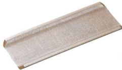
11-192-17 ㊦ 布目おしぼり受け 銀 ¥ 1,050 (W178・D72・H13)