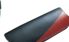
11-192-19 ㊦ 塗分け乾漆おしぼり受け 黒/朱 ¥ 1,450 (W193・D78)