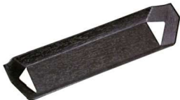
11-192-2 ㊦ 笹舟おしぼり受け 黒 ¥ 290 (W185・D73・H20)