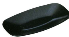
11-192-4 ㊦ 会席おしぼり受け 黒干漆 ¥ 700 (W154・D82・H15)