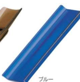
ブルー 11-192-31 ¥ 570 (W188・D90・H15) アンバー・スモーク・ブルー