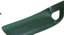
11-192-18 ㊦ 笹舟おしぼり受け グリーン ¥ 700 (W200・D77・H55) 全面塗